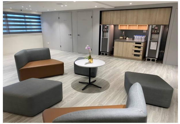
會務會館 12F 學員休息區