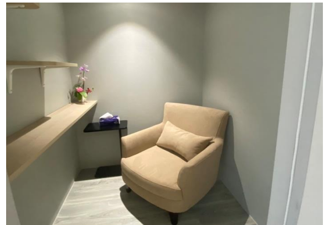
會務會館 12F 哺(集)乳室