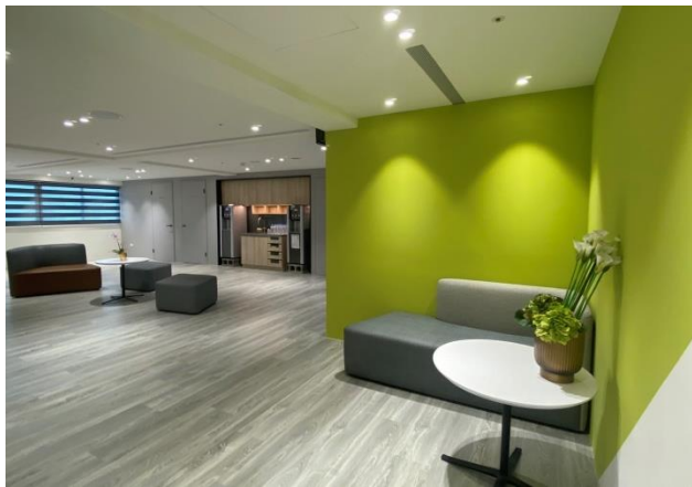
會務會館 12F 大廳一隅