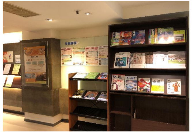
會務會館 11F 大廳一隅