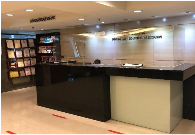
會務會館 11F 櫃台