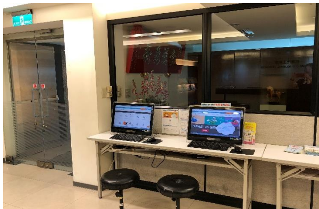
會務會館 11F 大廳一隅